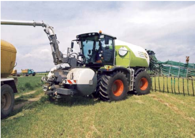
Grünland: Emissionsmindernde Ausbringtechnik

Die Tierhaltung in Deutschland wird aufgrund der Feststellung und Bewertung der Zusammenhänge und Ursachen durch den Klimawandel in unterschiedlichem Maße betroffen sein. Bei den Anpassungsstrategien innerhalb der Produktionsverfahren sind tierartspezifische und regionale Aspekte zu beachten, die zu flexiblen und abgestuften Anpassungsstrategien führen.